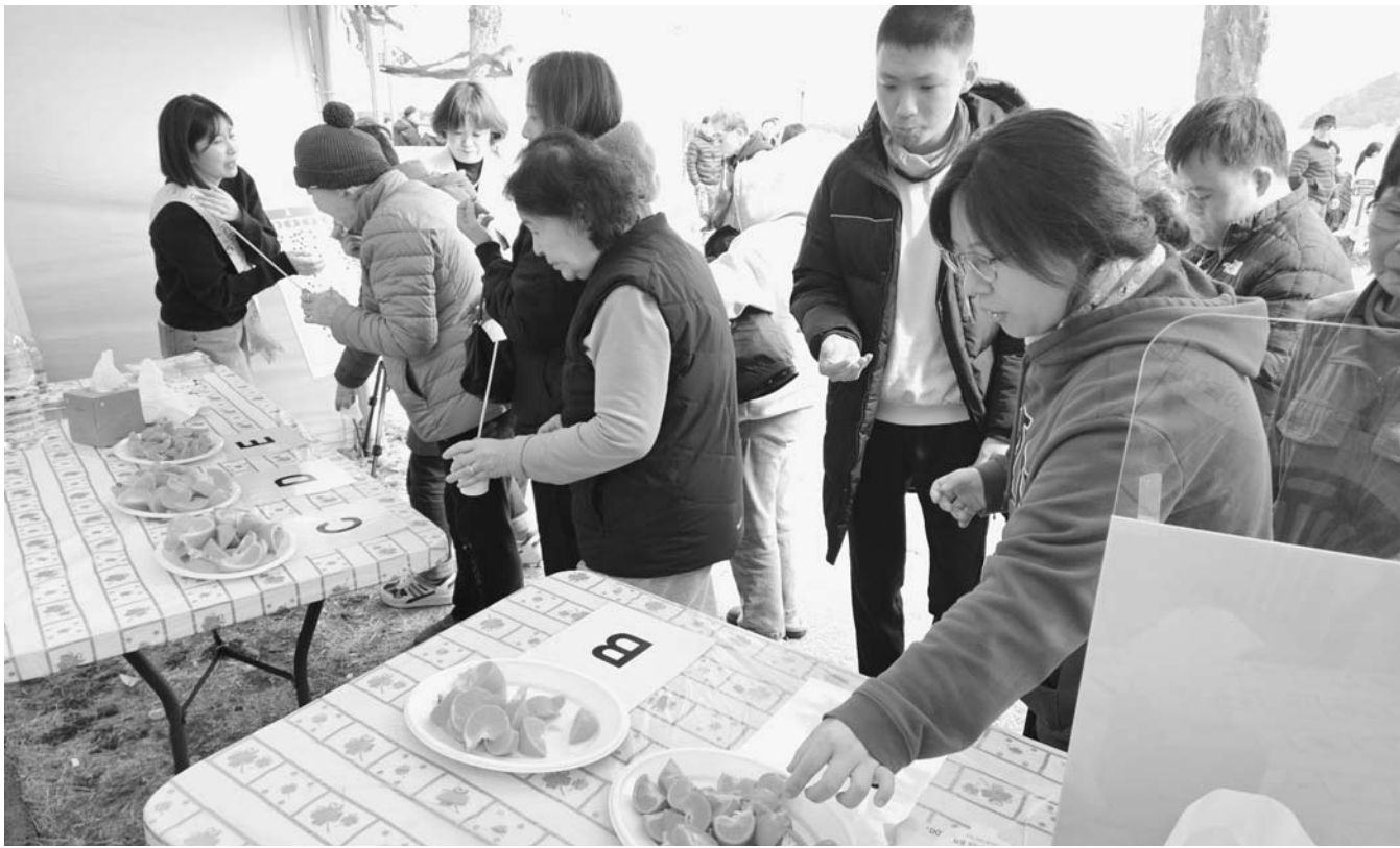
지난 6일 서귀포시 자구리공원에서 열린 송산동 부시리축제장에서 진행된 ‘제주 만감류 및 미국산 만다린 현장 평가회’.