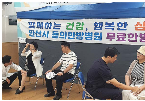
경기도 안산시 소재 동의한방병원이 지난해에 이어 올해도 삼양동주민센터에서 주민들을 대상으로 무료 한방진료에 나선다.

앞서 이들은 지난해 무료 한방진료를 실시해 이틀간 지역주민 150여 명에게 한방상담과 진료를 제공하며 주민들로부터 큰 호응을 얻었다.