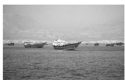
미·이란 종전 합의 후 호르무즈 해협, 연합함대

그럼에도 종전 MOU 체결이 임박했다는 관측이 우세했던 가운데 이번에는 이스라엘이 또다시 끼어