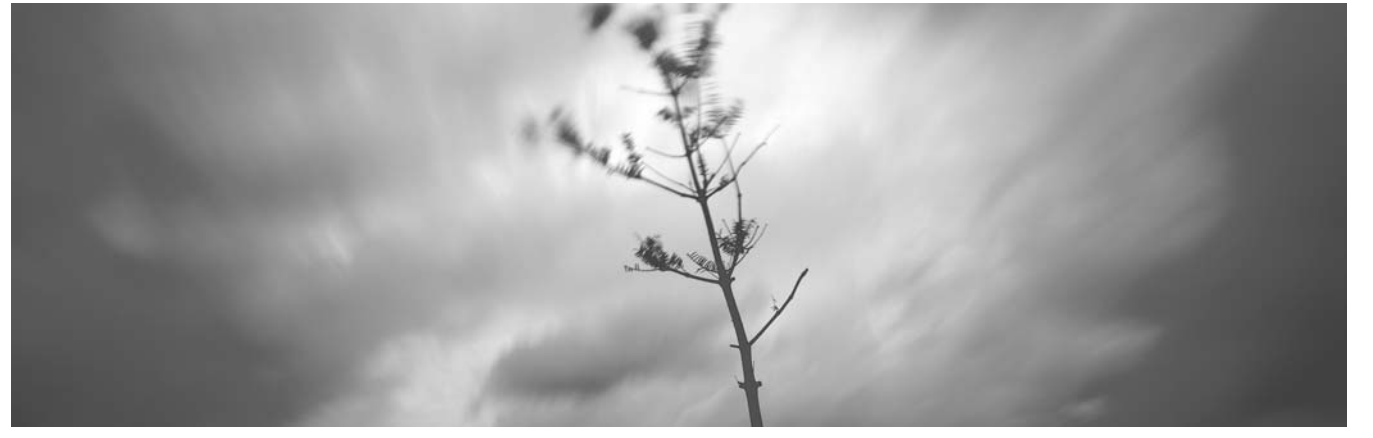
김영갑 기증 사진전 전시 작품. 나무, 하늘, 구름을 담은 말년의 작품 중 하나다.