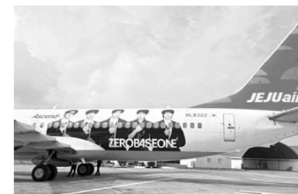
K-POP 아티스트 '제로베이스원'(ZERObASEON)과 협업한 제주항공의 '제로베이스원 레퍼 항공기'.

제주항공의 올해 수송객이 5개월 연속 100만명을 넘긴 것으로 나타났다. 제주항공은 5월 수송객이 110만 7549명으로, 지난해 같은 기간(102만9004명)에 비해 7.6% 증가했다고 15일 밝혔다. 국내선은 41만 5966명에서 42만4036명으로 1.9%, 국제선은 61만3038명에서 68만3513명으로 11.5% 늘었다.