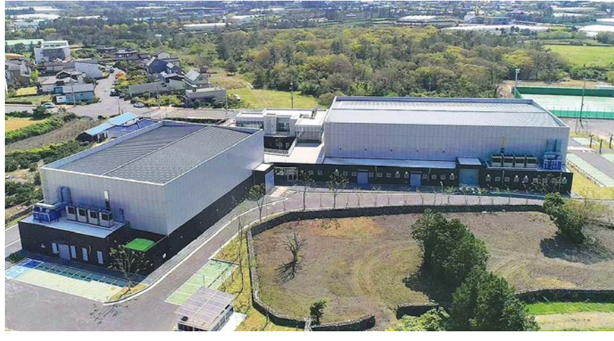
제주시 한경면에 있는 촬영장 시설인 제주실내영상스튜디오 전경. 제주실내영상스튜디오 제주

환경면 실내영상스튜디오 대규모 촬영 한계 등 보완 1~3단계별 클러스터 구축 최소 800억대 인프라 구성 1단계 야외 촬영장은 80억